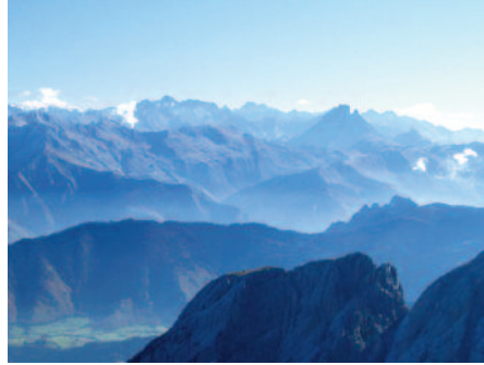
A la fi del segle XVIII el sector pirinenc que va del pic d'Aussau –a la imatge– a Luishon és el més freqüentat.

Quant a les altituds, des de l'època dels romans el Canigó era considerat com la muntanya més alta del Pirineu. I de fet ho és, encara que no en sigui la més elevada, perquè del peu al cim hi ha un desnivell que supera els 2.500 m. El 1703 hi apareix amb una altitud de 2.808 m, 23 més dels que té en realitat. Altres muntanyes visibles des del pla i en certa manera aïllades de la resta de la serralada tingueren la mateixa consideració, com el Mont Valièr, el pic del Mièdia de Bigòrra i el pic d'Aussau. El 1726 La Blotière està convençut que la Maladeta és la més elevada del Pirineu perquè té