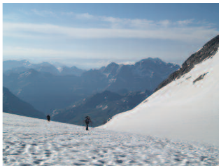
Louis Ramond de Carbonières va cercar, als segles XVIII i XIX, una via d'accés al cim del Mont Perdut, vist a la imatge des de la glacera del Vinhamala.