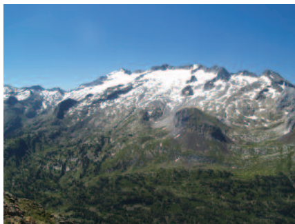
El 16 de juliol de 1858 Alfred Tonnellé arriba al cim de l'Aneto.

Neix a Tours el 1831. Metge i estudiós de l'art i de la filosofia, duu a terme alguns viatges abans de sortir, l'estiu de 1858, a conèixer el Pirineu. Després d'efectuar una sèrie d'ascensions pel Pirineu central –entre les quals la segona als pics de Crabioules (Crabioules) i la primera a l'aranès Malh des Pois o la Forcanda, muntanya per la qual sent una atracció especial–, fa una llarga travessia cap al Pirineu oriental. Quan arriba a Perpinyà es troba malament i mor de febre tifoidea a la casa materna poc després, el 14 d'octubre, a l'edat de 27 anys. La seva mare arreplega els quaderns del diari que Tonnellé havia escrit i els converteix en un llibre, Trois mois aux Pyrénées et dans le Midi en 1858: journal de voyage , que ofereix als amics del fill un any després. Les edicions d'aquest llibre sempre han estat reduïdes. Josep M. Cuenca