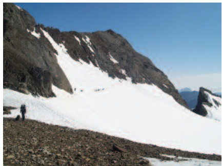
Més endavant, el 1881, féu excavar les coves de la Vila Russell al Vinhamala.