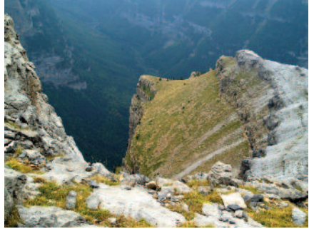
Lucien Briet recorre el Pirineu aragonès i divulga la vall d'Ordesa, a la imatge vista des de la Faja de las Flores.

que pretén honorar amb una obra. Fotògraf excel·lent i narrador de talent, no triga a publicar articles en revistes especialitzades de l'època. Sol·licitat per diverses societats perquè hi vagi a fer conferències i projeccions d'imatges, la Societat Geogràfica de París l'invita als seus locals i li fa una acollida triomfal. Durant uns quants anys dedica les recerques al vessant nord, però després, el 1891, dirigeix els passos cap a les terres aragoneses, en concret a Bujaruelo, Torla i Ordesa. Al llarg de vuit anys consecutius (1904-1911), de vegades fent de 24 a 27 h marxa per camins de ferradura, recorre el vessant sud, principalment el Pirineu aragonès, en companyia de diversos guies francesos i aragonesos i de dues mules carregades de material, i explora sistemàticament la zona que s'ha proposat descobrir.