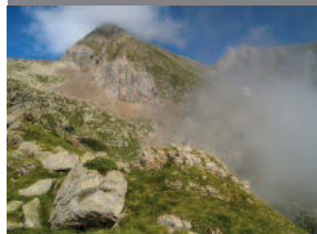
Diuen que el bisbe Valièr va pujar al Mont Valièr al segle III.