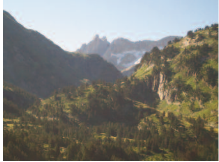
l'1 d'agost del mateix any duu a terme la primera ascensió al Malh des Pois o la Forcanada, muntanya que el té captivat.

tanmateix, fortalesa de merlets elevats i noia de cor altiu, finalment s'haurà de rendir. Té, veritablement, l'aire d'una fortalesa que vol defensar-se." Havent esmorzat decideixen atacar-la. L'acompanyen els guies Nate i Ribis. Fan alguns intents infructuosos i a continuació es dirigeixen a un coll a través d'una congesta dreta. Del coll al cim, la descripció de l'ascensió és èpica: "Ataquem la primera forcadura. Aquesta piràmide sense pendent, i més guarnida de puntes desplomades que no pas d'entalles on posar els peus, sembla impossible de grimpar.