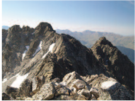
El 1869 Russell fa també la primera documentada al Comaloforno.