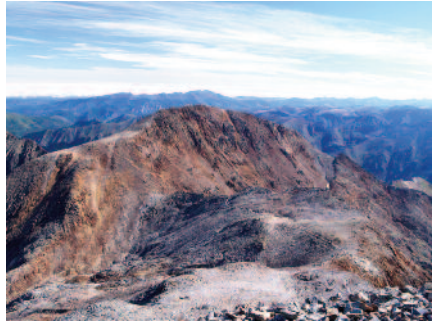
Vincent de Chausenque s'enfila al Montcalm el 1829, però una tempesta no el deixa arribar al cim de la pica d'Estats, des del qual està presa aquesta fotografia.

onze anys. Passa la infància a Sorese (Sorèze), poble de la Montanha Negra. Hi rep una formació molt bona. Li agraden la història natural, la botànica i la geologia. S'orienta vers la carrera militar i es desplaça a l'escola d'enginyeria a Metz, al nord de França, el 1802. En aquesta època fa les primeres excursions als Vosges. Al novembre de 1802 esdevé lloctinent i, per motius de salut, al juny de 1804 (té 22 anys) es trasllada a Baiona. Oficial topogràfic d'enginyeria, li encarreguen el servei dels plànols de Tarba (Tarbes), de Lorda (Lourdes) i de Barejàs (Barèges), als Pirineus Auts (Hautes-Pyrénées).