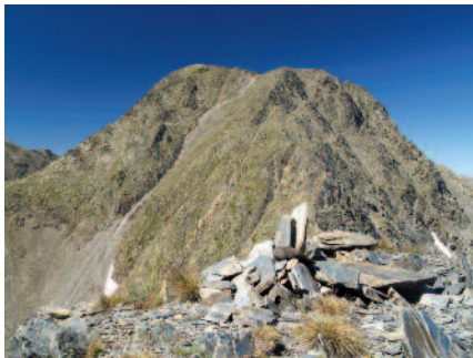
El comte Henry Russell realitza moltes ascensions al llarg del Pirineu, una de les quals, el 1864, és la primera documentada al Carlit.

Sol o amb els seus guies, efectua innombrables ascensions, entre les quals una trentena de primeres. Viu de la seva fortuna personal i de les rendes de les inversions bancàries. Durant l'hivern se sotmet als "constrenyiments" de la vida muntanya de l'alta societat, però els primers dies de l'estiu retorna als cims. Entre les seves primeres ascensions, a part de la de l'Ardiden el 1858, destaquen les del